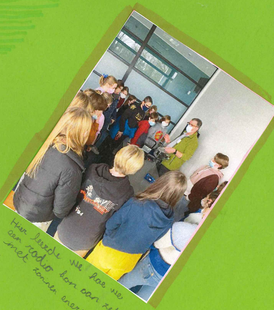
Hier leerde we hoe we een radio kan aan zetten met zonnenergie