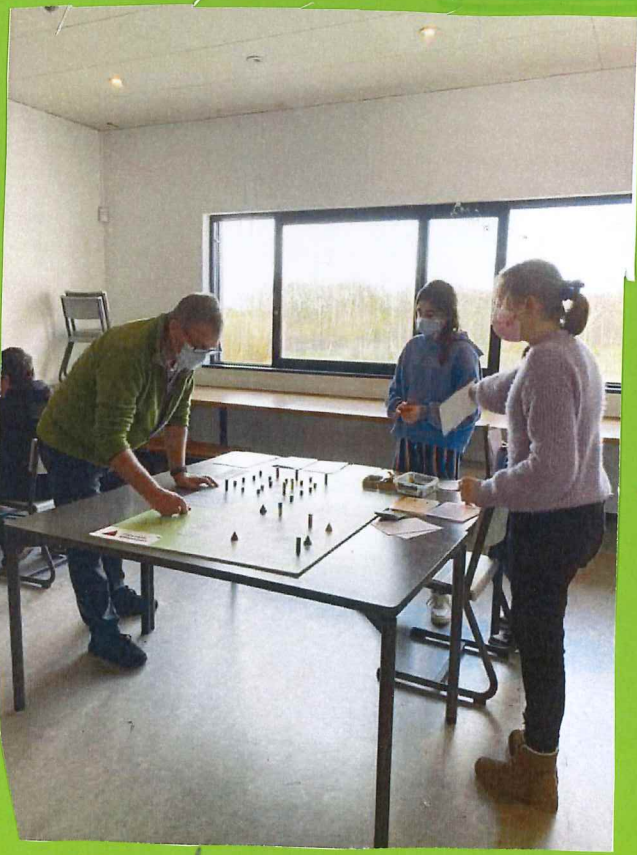
spel 4 op een rij