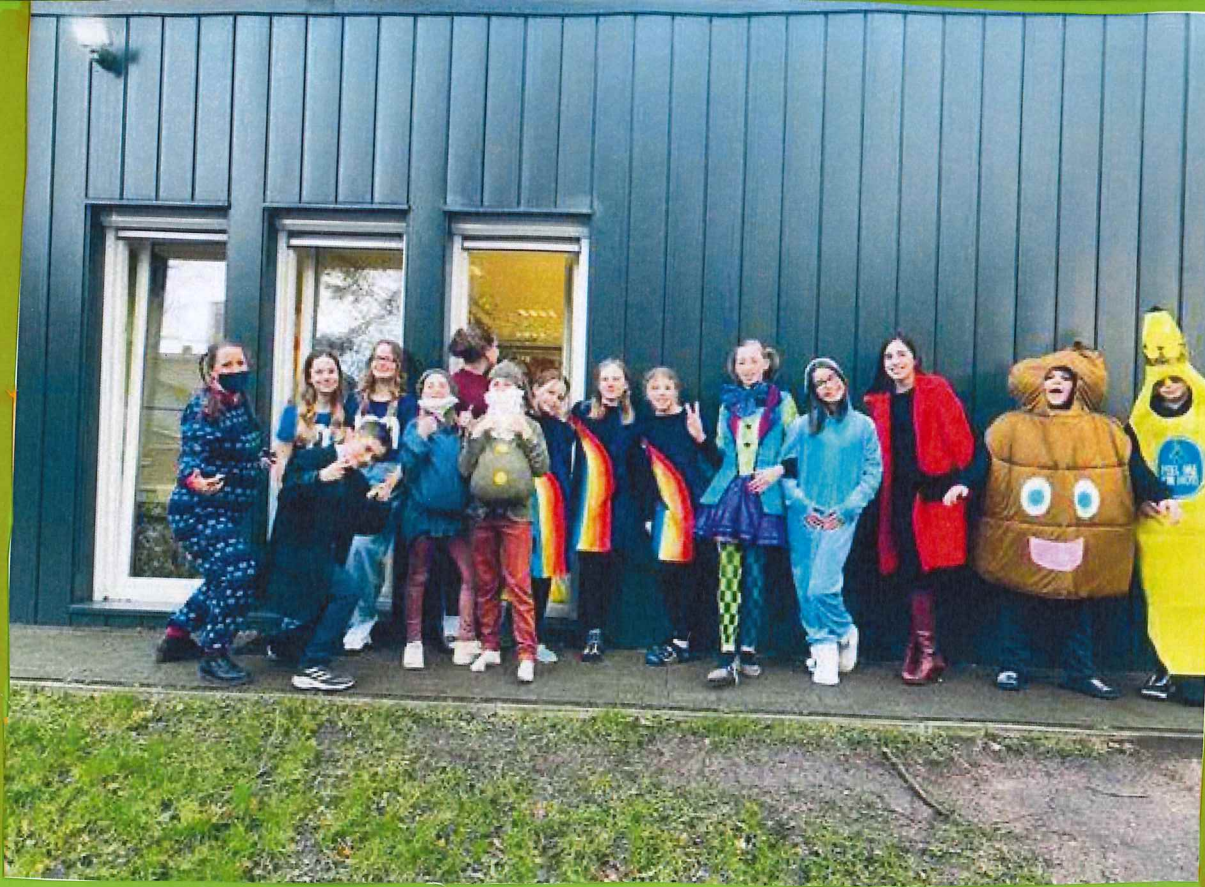
Hier zijn onze kostuums in carnaval!